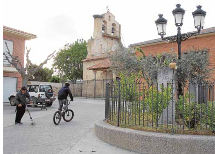
Localidad de Roales del Pan, en Zamora

Además, ello incidirá en el desarrollo de otras zonas rurales del entorno, ya que existe el compromiso de la empresa de incrementar la compra a proveedores locales, algo que ya ha comenzado a materializarse, según detalla la alcaldesa. Esa creación indirecta de riqueza y desarrollo en el mundo rural a través de sus compras de materia prima, también la cumplen otras agroalimentarias asentadas en el municipio, como embutidos El Turista, que aunque con domicilio social en Zamora e instalaciones en la carretera de La Hiniesta, es en el término municipal de Roales donde fabrica y cura sus chorizos, salchichones y jamones; y Cár-