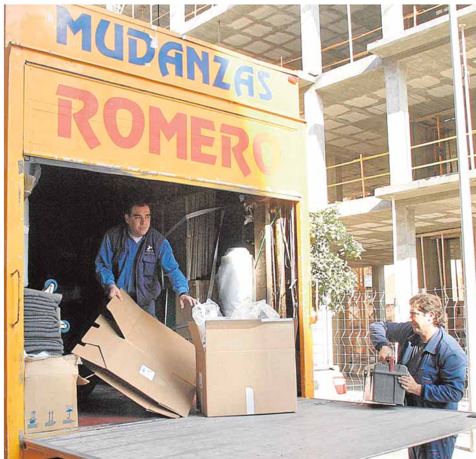
Una mudanza realizada por la empresa Romero

Consciente de que la situación actual requiere que las administraciones y las empresas del sector se sientan y vean cómo se