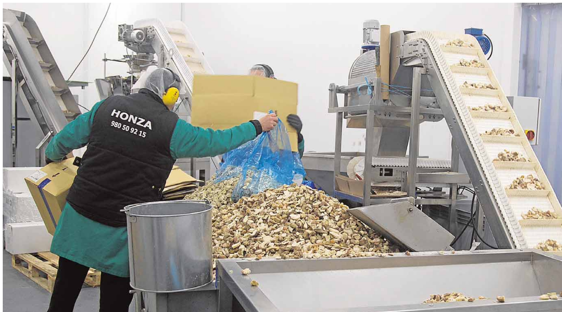
Instalaciones de la empresa Hongos de Zamora