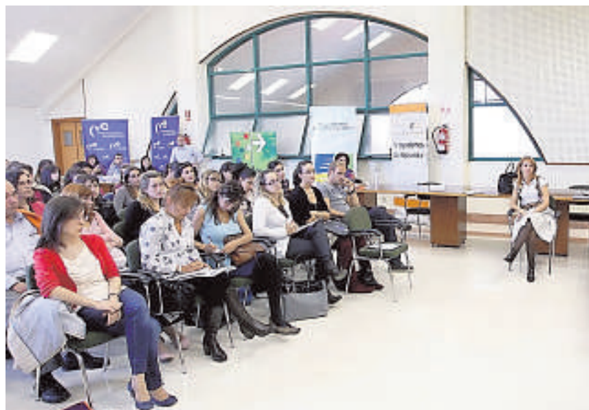
El Servicio de Ordenación Académica informa en la Casa del Estudiante F. B.

Hay más información en www.uva.es y en posgradoficial@uva.es .