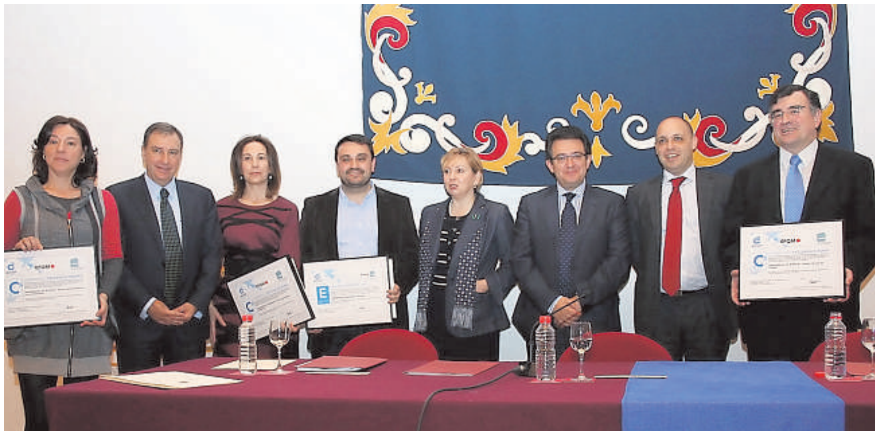
El rector (tercero por la derecha) y el consejero (segundo por la izquierda), durante la entrega de los sellos de calidad en esta Universidad