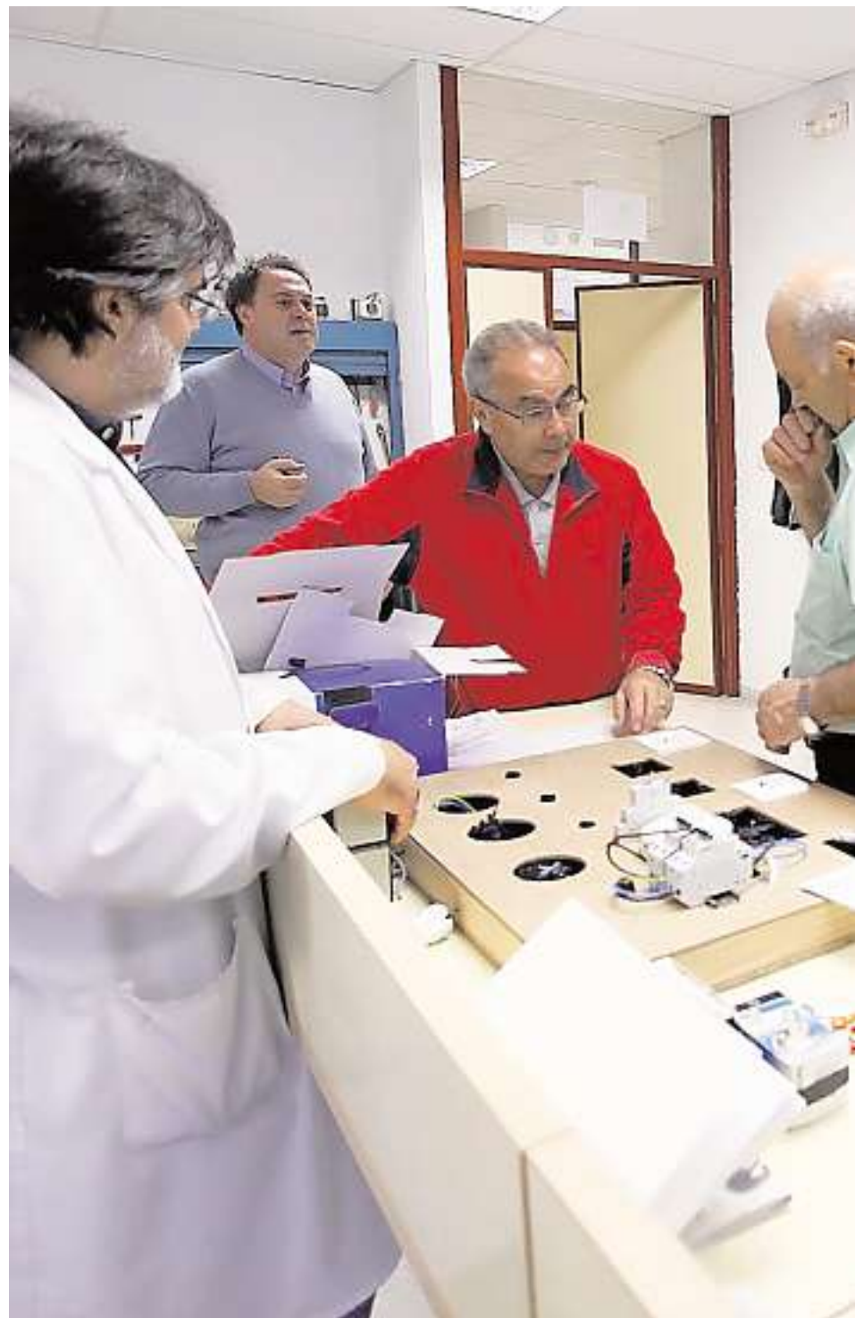
Una de las aulas taller de educación para adultos

Por último, el tercer bloque se centra en la formación para el desarrollo personal y social. Se divide en dos especialidades. La primera incluye cursos de Español para inmigrantes, de menos de 100 horas. La segunda opción abarca también otros cursos de menos de 100 horas, de contenidos muy variados: salud, interculturalidad, igualdad entre géneros o consumo, por ejemplo. Estos contenidos se pueden elaborar a la carta, según las particularidades del centro.