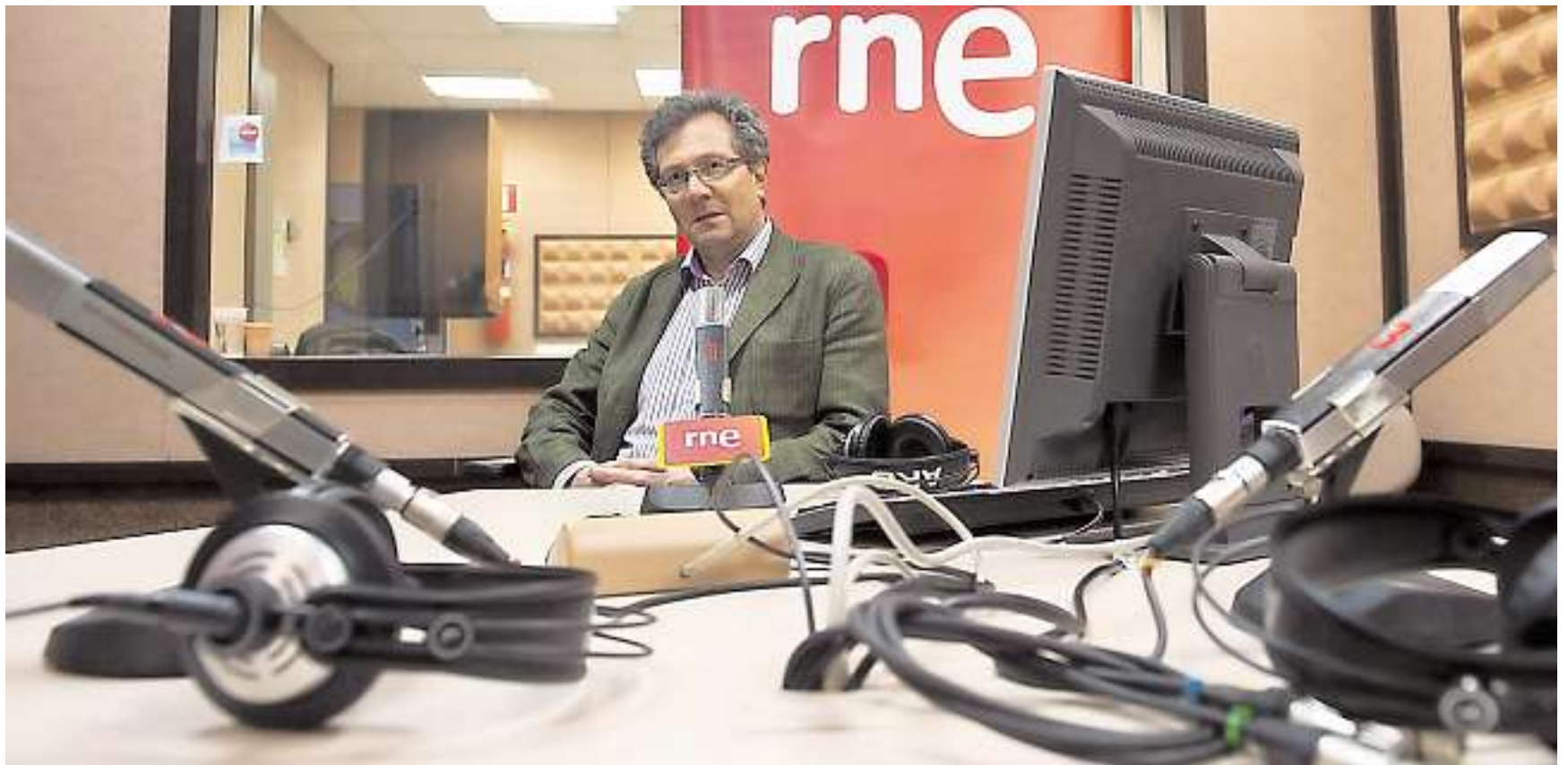
Chomón, que trabajó en RNE, asegura que el proceso de «centralización» de contenidos ocurre también en las cadenas privadas