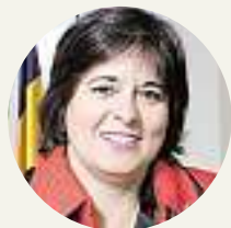
Mª DEL ROSARIO SÁEZ YUGUERO Rectora de la UCAV

«La crisis no nos puede hundir; en estos momentos también hay oportunidades que debemos aprovechar para ayudar a que el crecimiento económico se produzca»