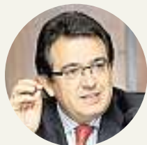
ALFONSO MURILLO Rector de la Universidad de Burgos

«La crisis no nos puede hundir; en estos momentos también hay oportunidades que debemos aprovechar para ayudar a que el crecimiento económico se produzca»