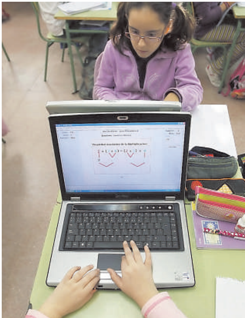
Las iniciativas se publicarán en la web www.educa.jcyl.es

Los proyectos son diseñados y elaborados por docentes en activo que están interesados en profundizar en conocimientos y metodologías didácticas en algunas materias o áreas es-