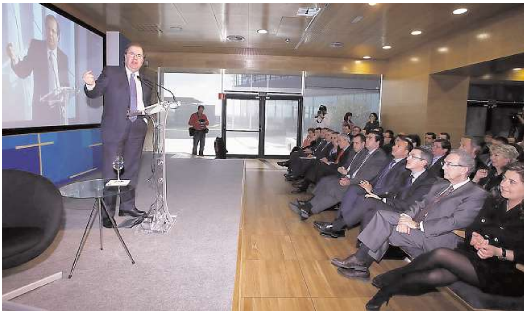
El presidente de la Junta de Castilla y León, Juan Vicente Herrera, presentó la actualización de esta estrategia