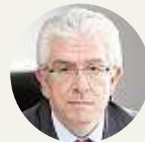
JOSÉ ÁNGEL HERMIDA Rector de la Universidad de León

«No es cuestión de poner más dinero sino de optimizar lo ya puesto encima de la mesa y no duplicar esfuerzos, sino hacer un proyecto común que haga más atractivo el sistema»