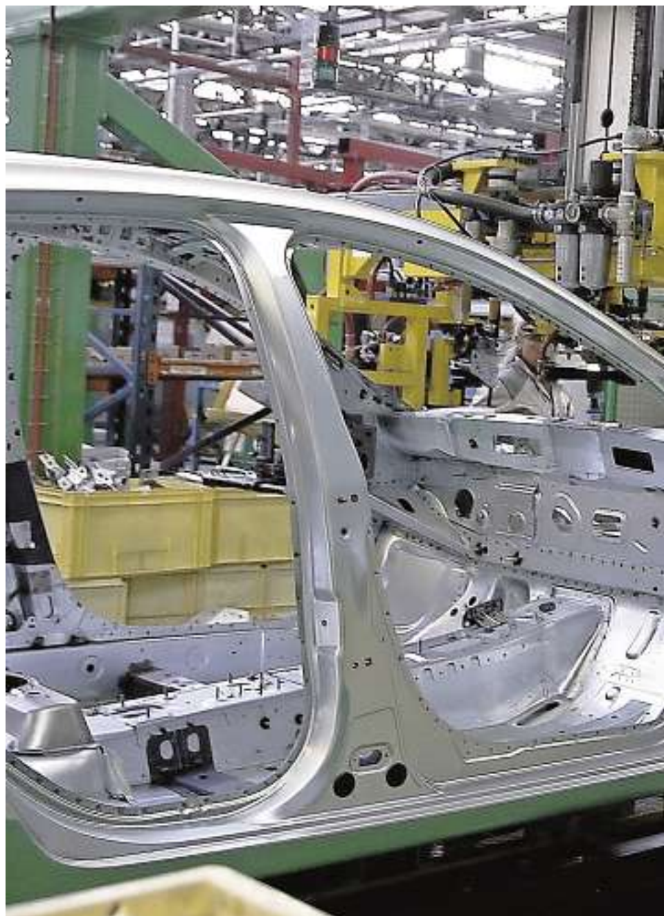
Renault es una de las integrantes del Foro de Empresas Líderes

500 pymes han contado con el asesoramiento y apoyo de alguna de las empresas que forman parte del Foro