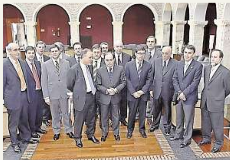
Constitución del Foro en marzo de 2006