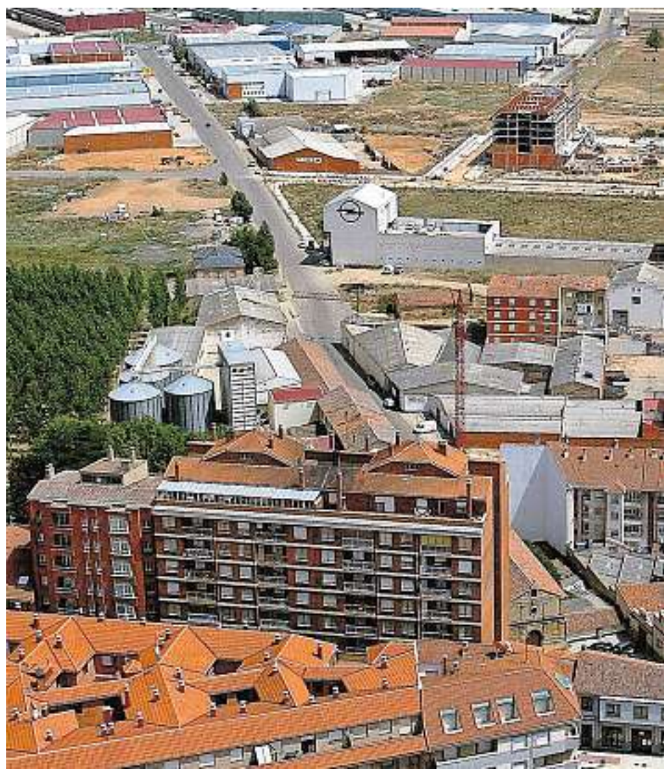
Imagen de Benavente, con el Centro de Transportes al fondo