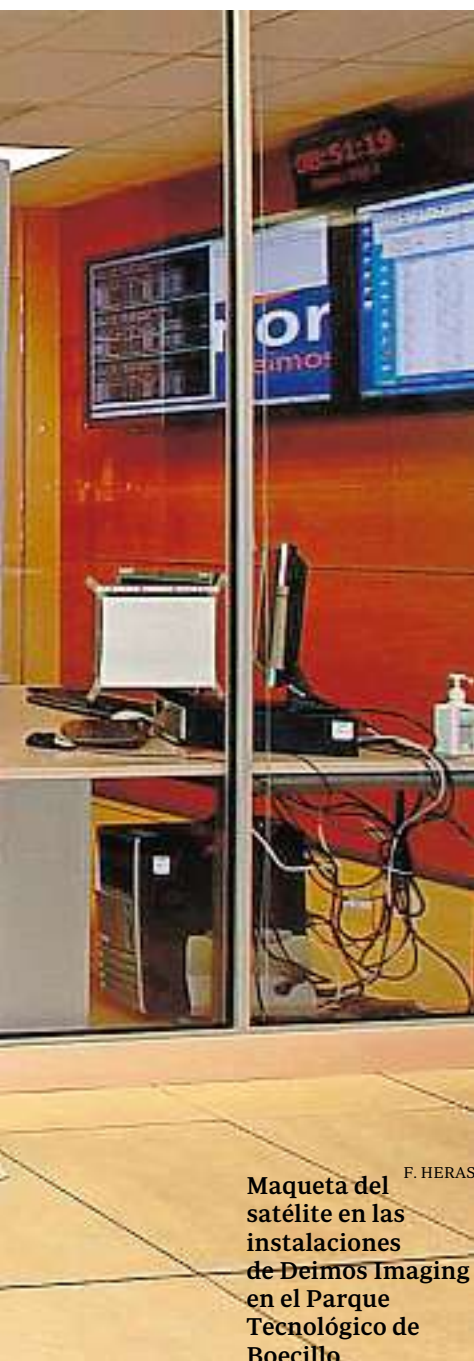
Maqueta del satélite en las instalaciones de Deimos Imaging en el Parque Tecnológico de Boecillo.