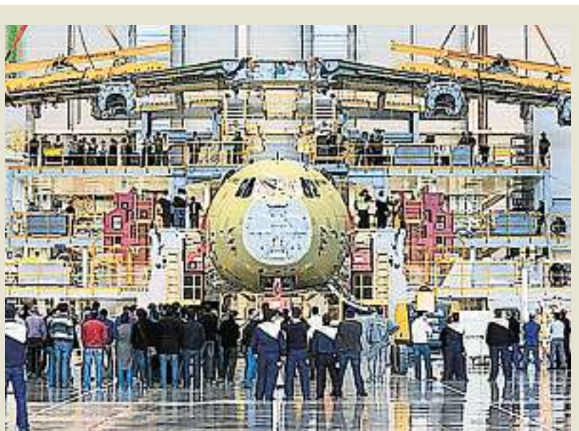
El grupo Palentino Inmapa también fabrica piezas para el Airbus