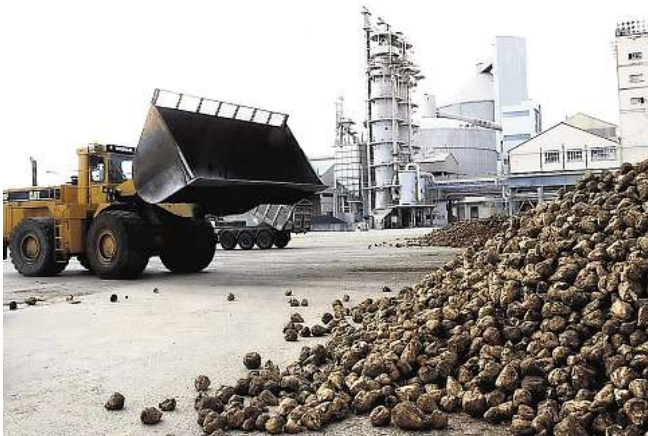
Recepción de remolacha en la fábrica zamorana de Toro