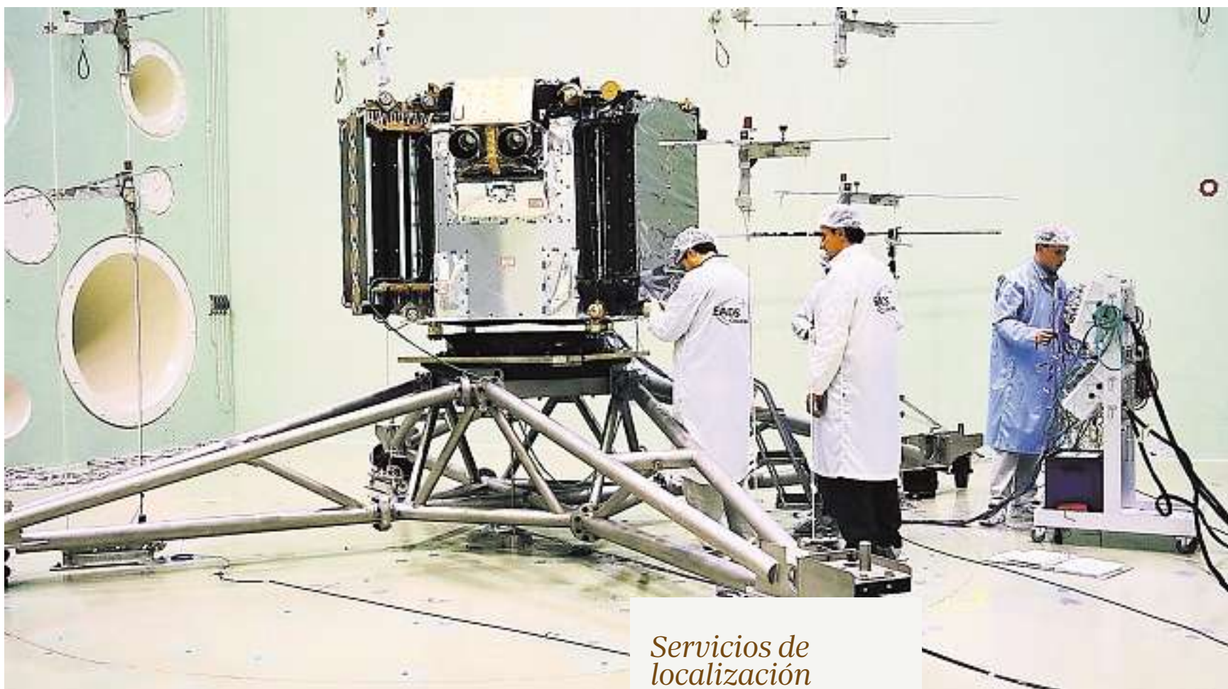
Montaje del satélite Deimos 1 para su lanzamiento al espacio