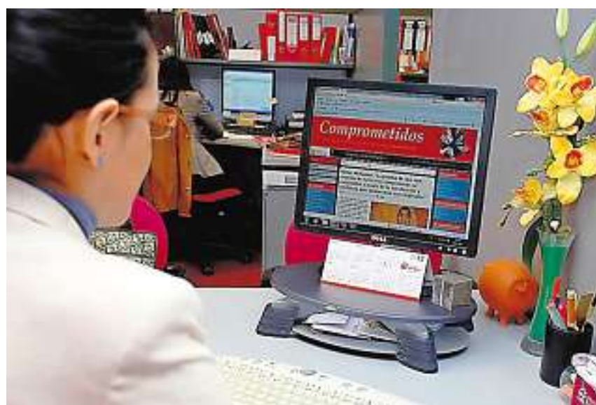
Una trabajadora de Grupo Norte navega por el portal «Comprometidos»

Los resultados demuestran que esta mejora en el fluir de la comunicación repercute en la efectividad del trabajo en equipo, se reduzcan los costes y tiempos en coaching o en recolección de opiniones, además de que aumentan el interés y la motivación de los usuarios que encuentran un espacio de confianza en el que pueden opinar y sentirse integrados.