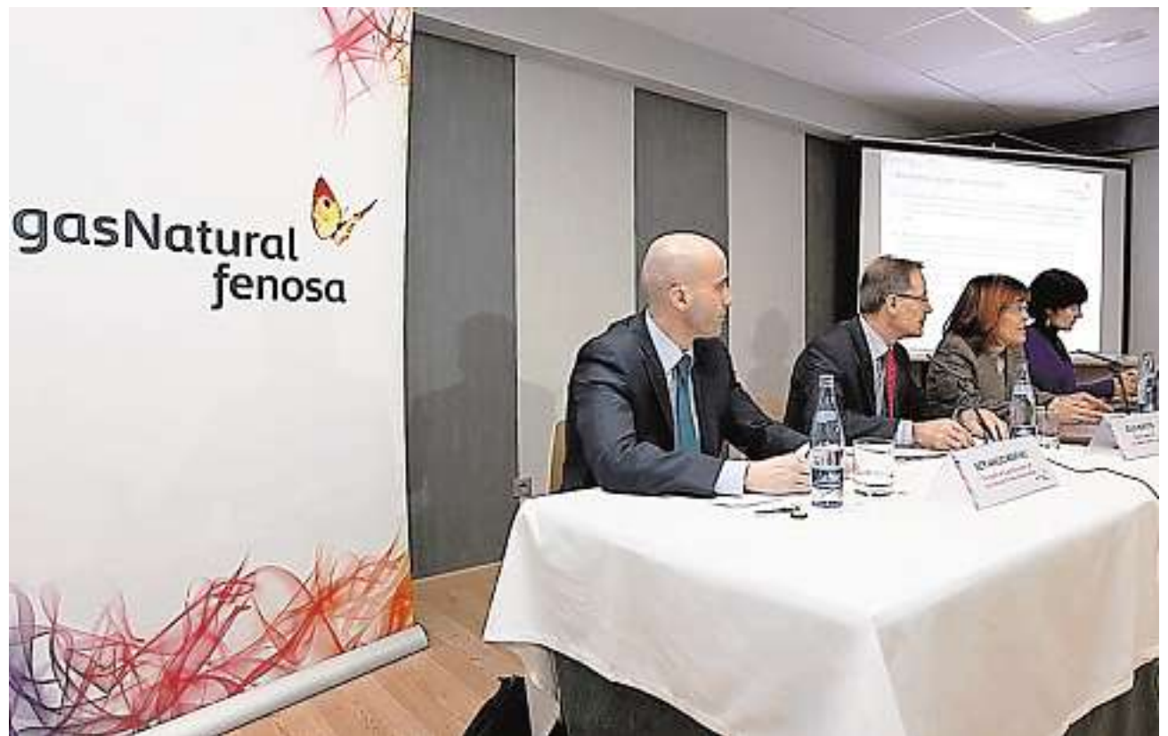
Responsables de Gas Natural Fenosa durante la presentación de los datos de la compañía

Galletas Gullón cuenta con más de 800 personas en Aguilar de Campoo y una facturación que superó los 174 millones de euros en 2011. La compañía confía en el mantenimiento de sus niveles de crecimiento para consolidarse como el principal motor en el tejido económico de la Montaña Palentina.