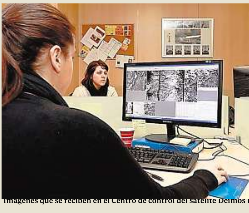
Imágenes que se reciben en el Centro de control del satélite Deimos 1

sorcio muy influenciado políticamente por los intereses de los Estados europeos que entran a formar parte del mismo, entre ellos España. Por otro lado, el gigante estadounidense Boeing, que desarrolla su actividad industrial en aquel país con unos parámetros de actuación mucho más ligados a reglas de mercado y sin estar sometido a los dictámenes de Estados que intervienen en las decisiones de un enorme consorcio como el de Airbus.